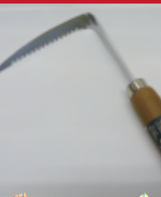
金物展示即売館賞