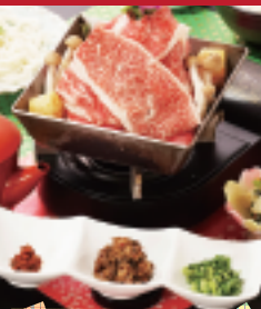
和食レストラン賞

※上記の賞品から一つ選んで応募。※引換券の発送をもって発表にかえさせていただきます。※景品の発送はできません。当道の駅にて受取り可能な方限定。