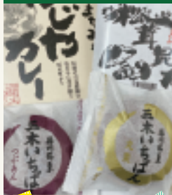
観光センターみき賞