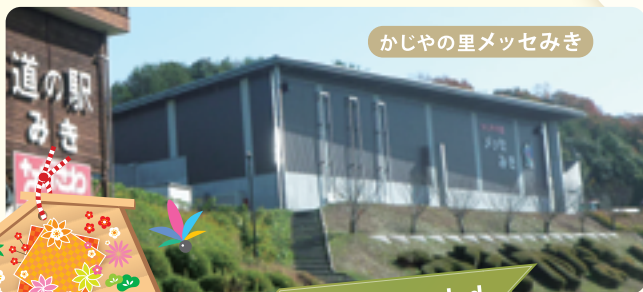
かじやの里メッセみき

道の駅みきには、レストラン・金物展示即売館・JA直売所など地域に特化した店舗が入っています。館内2階には、有料の貸室があり幅広くご利用いただいております。